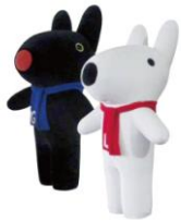
© 2014 Anne Gutman & Georg Hallensleben / Hachette Livre

期間中、ソニーグループが展開しているキャラクターたち、フランス生まれの絵本キャラクター“リサとガスパー”やコットンアニメーションが話題の“うさぎのモフィ”、プレイステーション®の各フォーマット専用ソフトウェア「どこでもいっしょ」シリーズのキャラクター“トロ”も応援に参加する予定です。