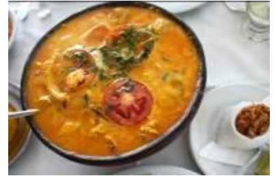
※料理写真はイメージ