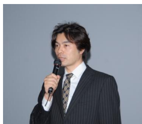
プラネタリウム製作・監修 大平技研 大平 貴之 様