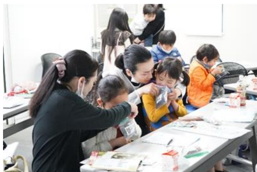
【子どもたちが牧草や堆肥のにおいを感じている様子】