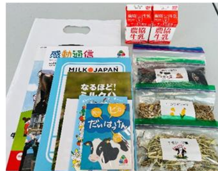
【事前に送付した教材と農協牛乳】