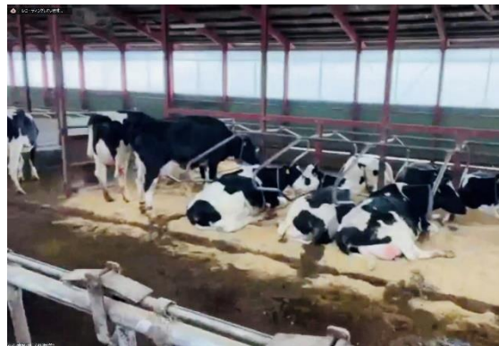
【牧場の牛たちの様子を配信】