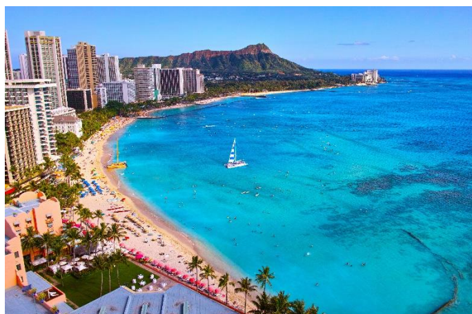
ハワイ オアフ島 ワイキキビーチ

また、オーストラリアは国内のビーチリゾートであるゴールドコーストが、韓国では済州島が、それぞれ両シーズンで1位となりました。