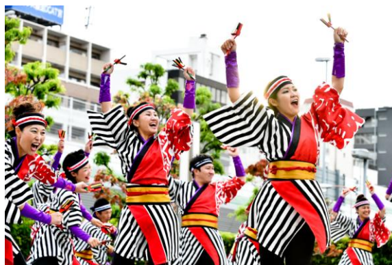
(写真は「第7・8回よさこい大阪大会」の様子)

「道頓堀リバーフェスティバル」は、大阪ミナミの芸能文化から現代のポップカルチャーまで、大阪の魅力やエンターテインメントを集めた大阪最大級の街フェスティバルです。道頓堀川の東西に大きく分けて5つの会場があり、それぞれに特設ステージが設置され、ミナミの食文化を発信する飲食スペースやイベントブースなどが出展されます。