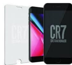
CR7 iPhone 6/6s/7/8 用