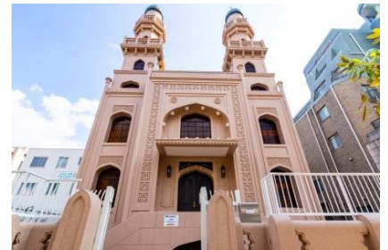
〈スポット例〉北野にある日本最古のモスク「神戸ムスリムモスク」

スマートフォンで巡るスタンプラリー。神戸の海外感あふれるスポット約40箇所のうち、5箇所以上のスタンプを集めると抽選に応募可能。集めたスタンプの数が多いほど、当選確率が上がります。