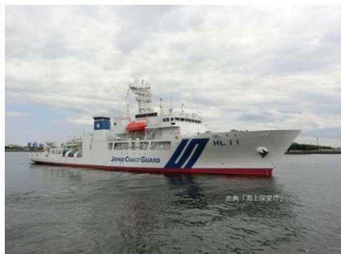
海上保安庁の測量船「平洋」

海洋の最新情報が集まる「Techno-Ocean」展示会。1986年にスタートしてから隔年神戸で開催されており、今年で第19回目を迎えます。