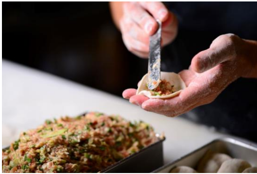
餃子作り体験（イメージ）

神戸のソウルフードの一つとして知られる「味噌ダレ餃子」発祥の人気有名店「元祖ぎょうざ苑」で餃子の世界にどっぷりと浸るプログラムです。