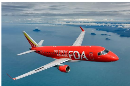
FDA 遊覧フライト (イメージ)

神戸空港発着 FDA チャーター便による特別遊覧フライトプログラム。遊覧前にはフジドリームエアラインズ (FDA) 整備士による航空教室とコックピットの見学を体験。飛行機をバックに記念撮影をした後は、瀬戸大橋と美しい瀬戸内の島々を上空から眺める60分間の遊覧フライトをお楽しみいただきます。