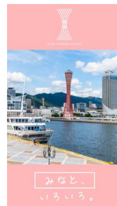
神戸観光 PR 映像の一例

放映内容：神戸ルミナリエ、ウォーターフロント、BE KOBE モニュメント 登山、南京町、北野、有馬温泉、神戸ビーフ等（合計 12 種類）