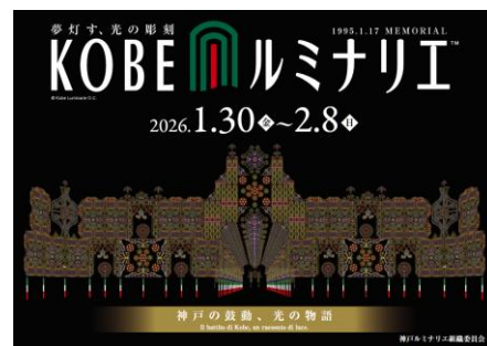
神戸ルミナリエのポスター