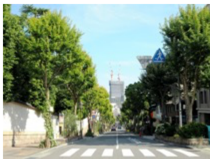
まるでイギリスのアビーロード！？ 北野坂 (神戸市中央区北野町)