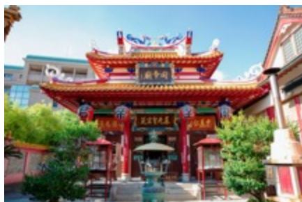
まるで中国！？ 関帝廟 (神戸市中央区中山手通)