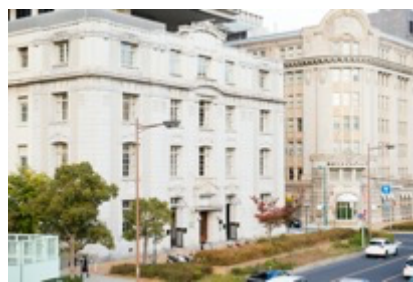
まるでニューヨーク！？ 神戸旧居留地 (神戸市中央区)