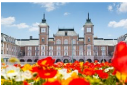
まるでオランダ！？ 神戸ホテルフルーツ・フラワー (神戸市北区大沢町)