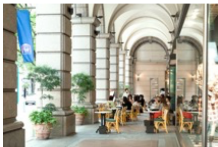
まるでイタリア！？ カフェラ 大丸神戸店 (神戸市中央区明石町)