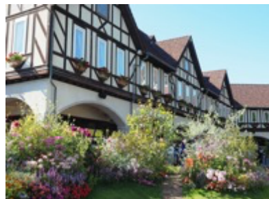
まるでドイツ！？ 神戸布引ハーブ園 (神戸市中央区北野町)