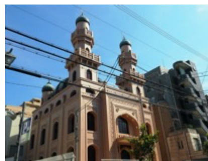
まるで中東！？ 神戸ムスリムモスク (神戸市中央区中山手通)