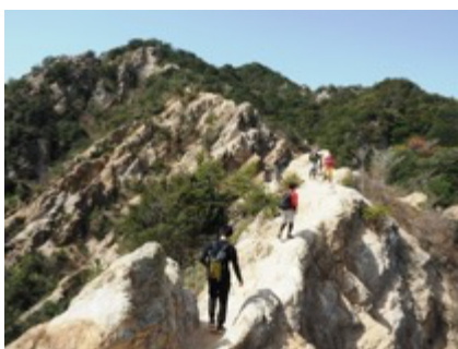
まるでカッパドキア！？ 須磨・馬の背 (神戸市須磨区)