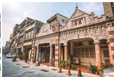
バロック様式の建物と上部に施された装飾が美しい大溪（ダーシー）地区