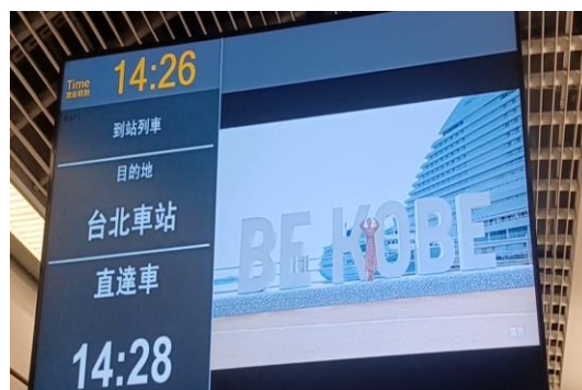
桃園メトロ内で神戸のプロモーション動画を放映している様子

全世界の中で、訪日外客数の伸び率が香港に次いで第2位、かつ訪日旅行客数が第1位の韓国に迫る親日家が多い台湾市場。中でも桃園市は、台湾のハブ空港である「台湾桃園国際空港」があり、2019年には空港と台北市を結ぶ列車「桃園メトロ」と「阪神電気鉄道株式会社（以下、阪神電鉄）」が、台湾・日本間の相互送客のための連携協定を締結しています。神戸観光局では、昨年度より阪神電車と連携し、共同で神戸観光プロモーション映像やパンフレットの制作などを行い、現在「桃園メトロ」では車内や駅で動画を放映中。