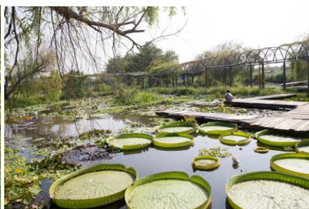
蓮荷園レジャー農園のオオオニバス水上漂体験では、葉に乗る体験ができる