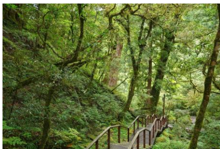
保護地区は標高 1,500m から 2,130m に広がっており、歩道沿いに立つ 24 本の巨木は樹齢 500 年から 1495 年と推定されている

また、桃園市の中で最も早く発展した地区と云われている大溪（ダーシー）は、かつて流行したバロック風建築が多く残っており、文化が融合した街並みが特徴。和平路、中山路では今でも多く残っており、その趣を感じることができます。台湾名物の「夜市」も多くあり、観光地としての魅力と交通の便利さを兼ね備えた都市です。