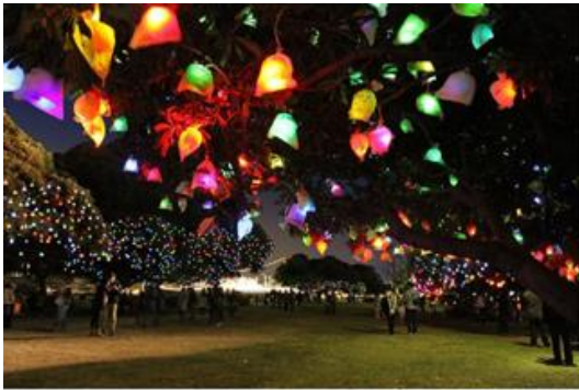
高橋匡太(ひかりの実)2011年 山下公園、横浜市、神奈川、photo 村上美都 (展示イメージ)

「ザ・ナイトミュージアム」公式HP： https://www.rokkosan.com/top/season_event/art/15251/