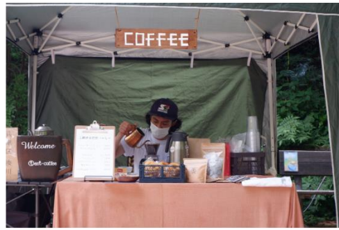
キッチンカーグルメイベント（イメージ）