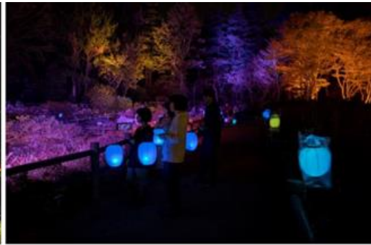
高橋匡太(Glow with Night Garden Project in Rokko 提灯行列ランドスケープ)2019年 六甲高山植物園