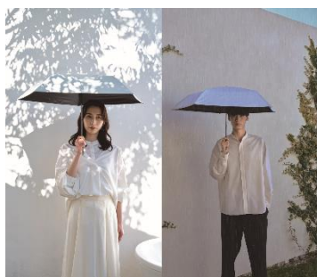
世界最軽量級の晴雨兼用傘 「マジカルテックプロテクション」

2024年2月1日(木)より発売開始した、世界最軽量級の晴雨兼用傘「マジカルテック プロテクション」は重さを感じさせない魔法のような軽さと機能を兼ね備え、「マジで軽い傘」として今年度のシリーズ売上を大きく牽引しています。