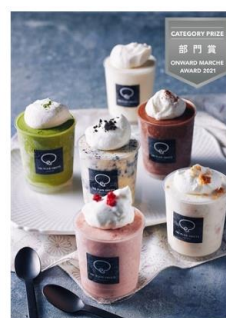
ギフト対応 THE PLAIN SWEETS リトルポッテ 6個入り