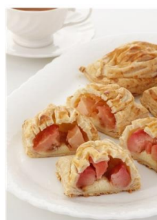
ギフト対応 タムラファーム とれたて紅玉のアップルパイ 5個入り