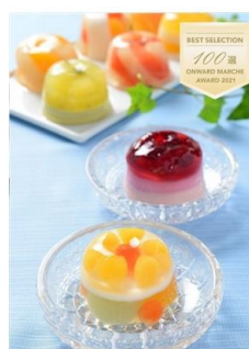
ギフト対応 たかはたファーム ミックスゼリー8個詰合せ