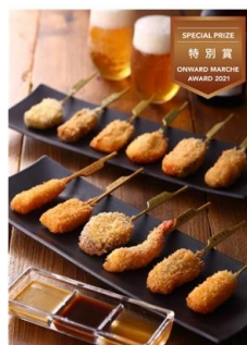
ギフト対応 神戸串乃家 串揚げセット (12種26本入り)