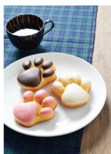
ギフト対応 ラトリエドゥシュクル 肉球マドレーヌ 6個入り