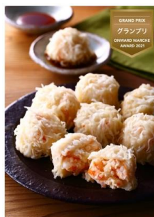
ギフト対応 オオゼキ 【オオゼキ】海老シュウマイ 16個入り