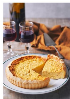
ギフト対応 レストランピーナス&マーズ ホタテのキッシュ