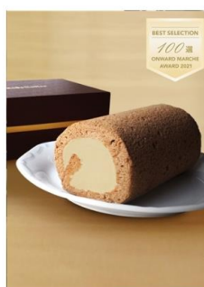
ギフト対応 ミカド珈琲 旧軽モカロールケーキ