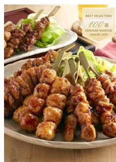
ギフト対応 博多華味鳥 【博多華味鳥】焼き鳥セット (20本入り)