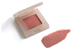
133 サンセットコッパー (旧色名：サンセット)