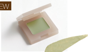
125 ライムグリーン くすみのないソフトで爽やかな グリーンでおしゃれな印象に