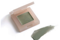
128 オリーブグリーン