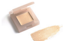
107 サンシャイングロウ (旧色名：サンシャイン)