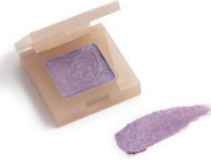
167 アメジストグロウ (旧色名：アメジスト)