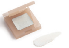
108 スターダストシルバー (旧色名：スターダスト)