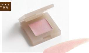
153 ピンクハーライト 白と赤の大きめパールを配合し ほんのりキラキラピンクで華やかな印象に