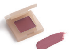
178 ダークレッド (旧色名：ナバ)