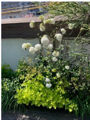
【ビバーナム エスキモー】