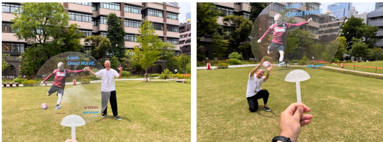
スケルトンうちわ投稿イメージ

WAVE 公式 Twitter : https://twitter.com/wavecontact