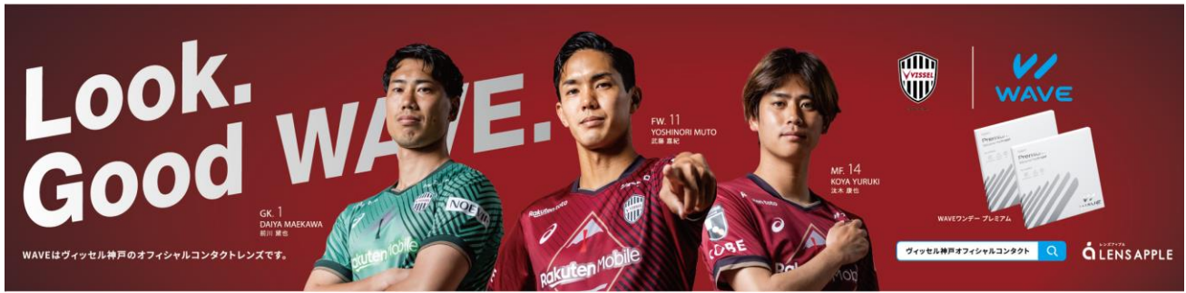
掲示中の交通広告