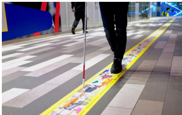
2023年3月～5月に渋谷スクランブルスクエア2F館外通路に敷設された点字ブロックアート