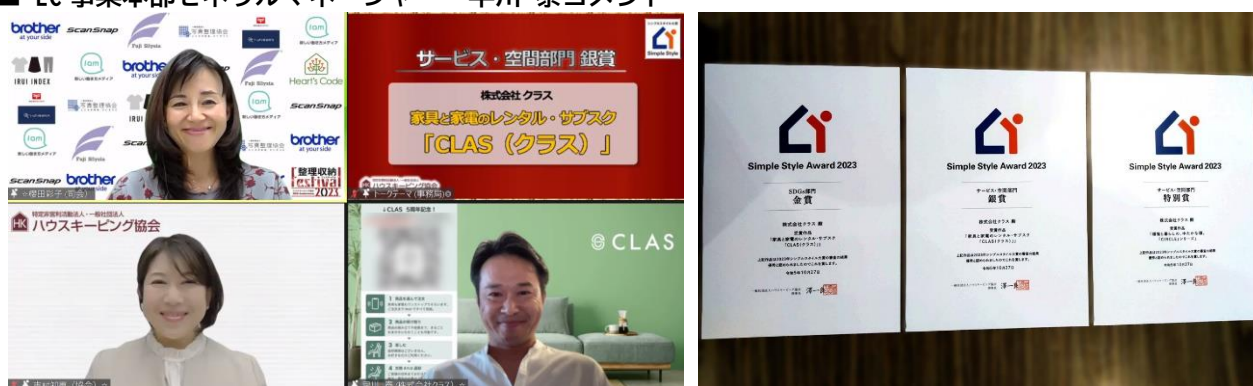
「シンプルスタイル大賞2023」オンライン表彰式の様子

この度はこのような栄誉ある賞をいただき、誠にありがとうございます。整理収納のスペシャリストである「整理収納アドバイザー」の皆さまに評価いただき、大変光栄です。