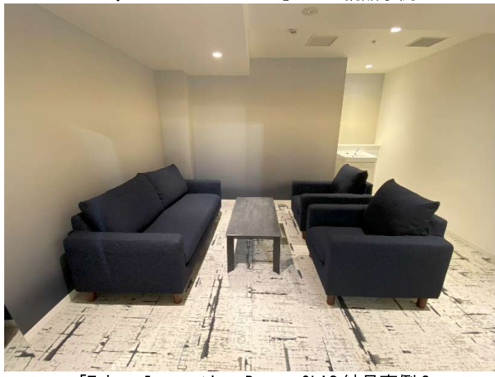
「Tokyo Innovation Base」CLAS 納品事例 2

TEL: 03-6407-9120 / e-mail: pr@clas.style