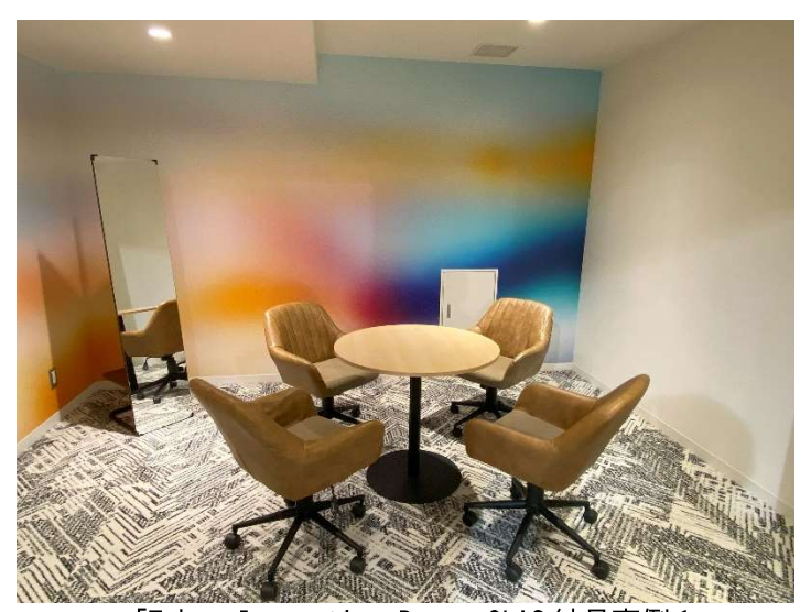
「Tokyo Innovation Base」 CLAS 納品事例 1

■場所:東京都千代田区丸の内 3-8-3 (SusHi Tech Square 2F)