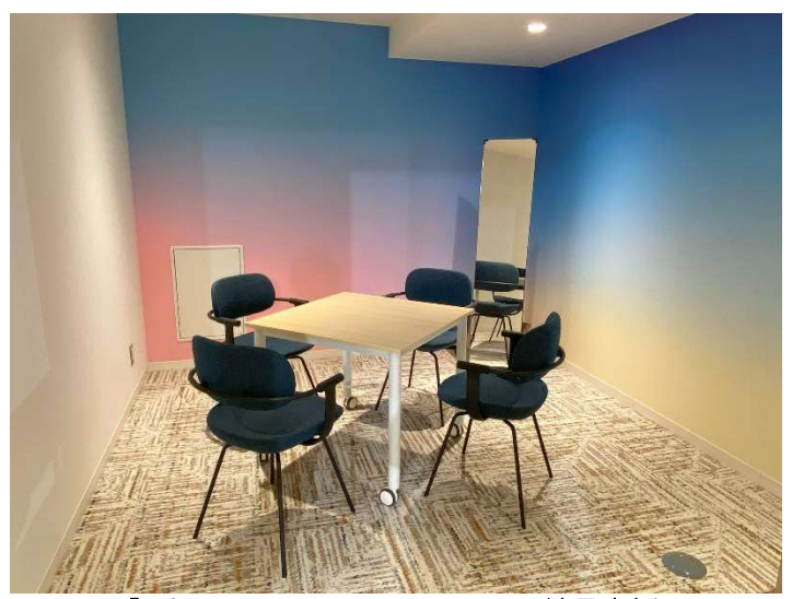
「Tokyo Innovation Base」CLAS 納品事例 3