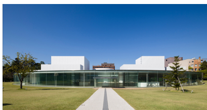
金沢21世紀美術館

名称：金沢21世紀美術館MUSEUM SELECTION 開催期間：2021年2月26日(金)～2月28日(日) 開催場所：金沢市内7か所、東京都内8か所 参加作家：村上慧、ダグ・エイケン 主催：文化庁、株式会社乃村工藝社 協力：金沢21世紀美術館 [公益財団法人金沢芸術創造財団] 企画に関する問い合わせ先：03-5962-1171（株式会社乃村工藝社 担当：市川・吉岡）