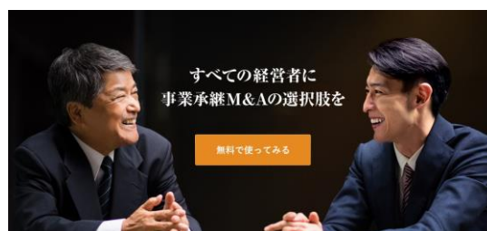
「ビズリーチ・サクシード」トップページ画像

「ビズリーチ・サクシード」は、株式・事業の譲渡を検討している経営者（以下、譲渡企業）と、譲り受けを検討している企業（以下、譲り受け企業）をつなぐオンラインプラットフォームです。譲渡企業は、「ビズリーチ・サクシード」に、会社や事業の概要を匿名で登録でき、譲り受け企業は、その情報を検索して関