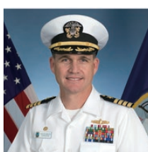
デビッド・ブレッツ大佐

フロリダ州ウィンターヘブン生まれ。1989年に米国海軍に任官し、1993年にマイアミ大学で医学博士号を取得。潜水艦母艦フランク・ケープルの潜水医官としての任期中、水上戦医務科士官資格を取得し、赤道越えの証であるゴールデン・シェルバックを取得。1997年には、家族医専門医資格を取得。2010年にハイチ地震の救援活動に従事。メリック大佐の受章した個人章及び従軍章には、功績章（2回）、海軍・海兵隊功績章（3回）、海軍・海兵隊業績章（2回）、戦闘優秀部隊表彰（2回）、イラク従軍章、人道支援任務従事章などが含まれる。