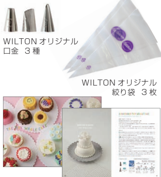
WILTON オリジナル 口金 3種