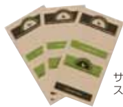
サンドイッチ用 ステッカー