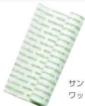
サンドイッチ用 ワックスペーパー