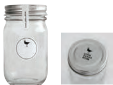
オリジナルロゴ入りガラスボトル1個