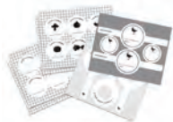
オリジナルボトルデコステッカー 6シート(31枚)