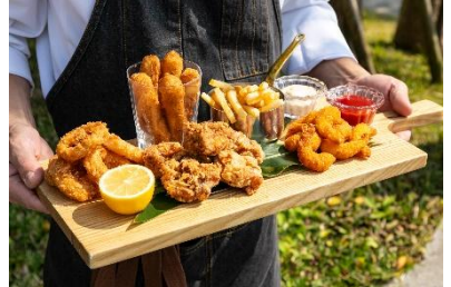
シェフ自慢のパーティープレート