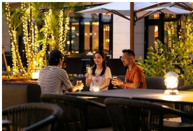
夜風が心地よいガーデンエリア