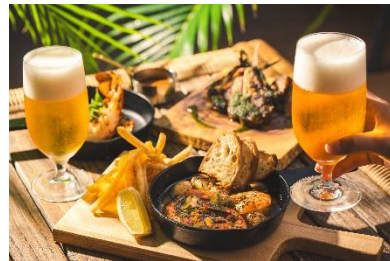
大満足なビアガーデンプラン