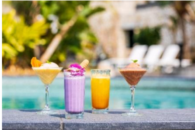
プールサイドバーでは、フォトジェニックなトロピカルカクテルを多数ご用意

ザ・アイランドにある屋外プールの一つ、グスクプール横に位置し、瀬良垣の海を広々一望できる、リゾート感満載のプールサイドバー。つい写真を撮りたくなるような鮮やかなトロピカルカクテルをはじめ、今年は粉からこだわったピザ生地を300度以上の窯で焼き上げる注目の「ピザサンド」も新メニューとして登場！定番のボリューム満点のバーガーに加え、家族やご友人と一緒にシェアリングが嬉しいパーティープレート等、本格的なフードメニューをご用意いたしております。