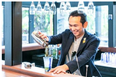
目の前でカクテルを仕上げる ロビーラウンジ&バー

ご友人との楽しい語らいや、静かにお1人で過ごしたいひととき、ロビーを行き交う人々を眺めながらリラックスしたいときにもロビーラウンジ&バーは最適な「つながる」ソーシャルスペーススポットです。心地よく洗練された空間で、ご自身らしい時間をバーテンダーの作り上げるカクテルとともに過ごしいただけます。また、キャンプ飯からアイデアを得たその食材や味にこだわり、シェフのセンスが光る豊富なフードメニューから選べるオーダー制のビュッフェプランと組み合わせて頂くことも可能。頭上に広がる星空でロマンチックな雰囲気が出された、屋内外がシームレスに繋がるガーデンエリアと合わせて、お気に入りの1品を見つけてください。