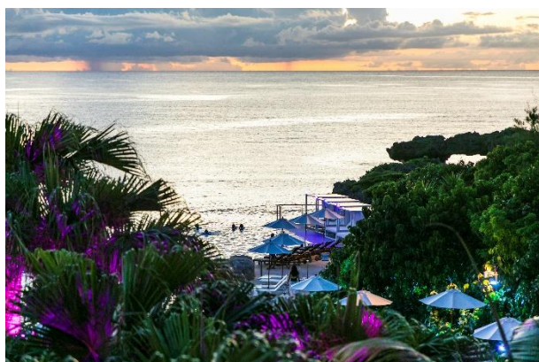
海と一体化する「ラグーン」

元気になれるラグジュアリーリゾート、ハイアット リージェンシー 瀬良垣アイランド 沖縄（沖縄県国頭郡恩納村、総支配人 村尾 茂樹）は、島まるごとリゾートホテルというユニークな立地を活かした「瀬良垣ナイトプール」を、ゴールデンウィーク期間中の2025年4月26日（土）～5月5日（月・祝）と、瀬良垣島が最も輝く夏季期間の2025年6月20日（金）～10月13日（月・祝）で開催いたします。さらに、インドア&アウトドアのバーを自由に行き来できる、ビバレッジ付き宿泊プラン「サマーエスケープ」も好評販売中です。絵のように美しい景色が広がる島特有のゆったりとしたひとときをお楽しみください。