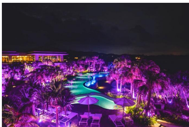
ギャラクシーピンクに染まる「グスクプール」