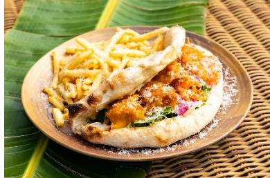
新メニュー「フライドフィッシュ ピザサンド」もラインナップ入り