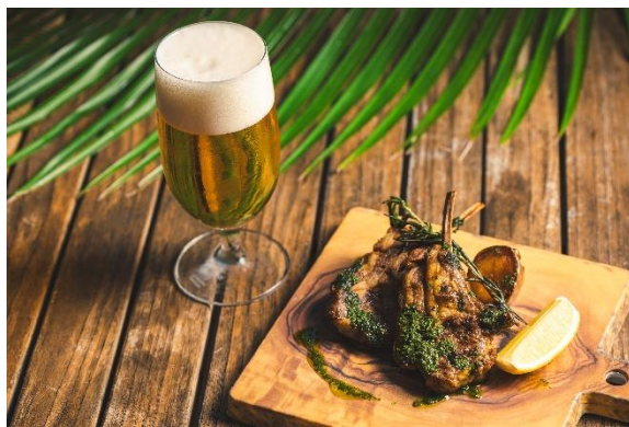
仔羊のグリル 島唐辛子のチミチヨリ

メニュー例) エビとマッシュルームのアヒージョ、バーベキュースタイルスペアリブ、マヒマヒのグリル 他