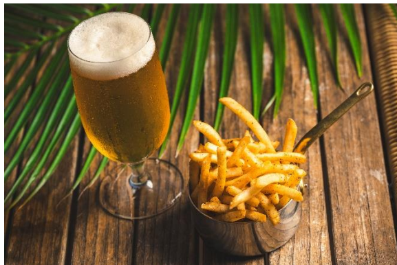
ポテトフライ - 月桃と島胡椒スパイス