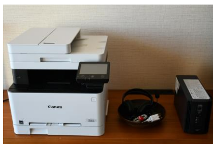
客室のリモートワーク応援機材

リージェンシークラブラウンジの会議室は事前に予約をいただければ、10時30分～17時の間 1日2時間まで無料で利用可能です。電話会議の場所としてもご利用いただけるように電話会議サポート機材も設置しています。また、客室にもスキャンプリンター（スキャン機能付き）、携帯充電用ケーブル、HDMI ケーブル、マイク付きヘッドフォン、無停電電源装置を設置し、快適なお仕事空間をご提供いたします。