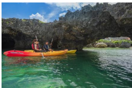
シーカヤックツアー

リージェンシークラブラウンジの会議室は事前に予約をいただければ、10時30分～17時の間 1日2時間まで無料で利用可能です。電話会議の場所としてもご利用いただけるように電話会議サポート機材も設置しています。また、客室にもスキャンプリンター（スキャン機能付き）、携帯充電用ケーブル、HDMI ケーブル、マイク付きヘッドフォン、無停電電源装置を設置し、快適なお仕事空間をご提供いたします。