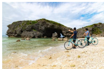
58号線うみかぜ自転車旅

透き通る瀬良垣の海の上での「シーカヤックツアー」や「SUP体験」、青く美しい海と空、海風を感じながら国道58号沿いを自転車で走る「58号線うみかぜ自転車旅」など、ホテルの目の前に広がる瀬良垣の自然を生かしたアクティビティをご用意しております。沖縄旅行の思い出になる、オリジナルのジェルキャンドル、フォトフレームを制作するクラフト体験や、ジェットスキーで引っ張るゴムボートに乗って海上を遊覧クルージングする、スピード感と爽快感溢れる「ドラゴンボート」など、お子様も楽しめるユニークなアクティビティも揃えています。