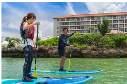
SUP(スタンドアップパドル)体験