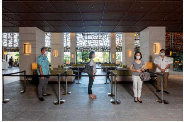
ソーシャルディスタンスを保ったチェックイン

当ホテルではお客様と従業員の安全と安心のため、ハイアットグループの新衛生基準となる「グローバルケア&クリーン」対策に沿って、様々な新型コロナウイルス感染症に対する予防対策を講じています。例えば、館内におけるアルコール消毒の強化、ソーシャルディスタンスの確保、従業員の健康管理の徹底及びマスク着用、お客様・従業員への検温の実施、また、レストランでは国際基準となっているHACCPに沿った衛生管理などを実施いたします。一日も早い感染拡大の収束を願うと共に、皆様のお越しを心よりお待ちしております。