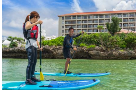
SUP(スタンドアップパドル)体験