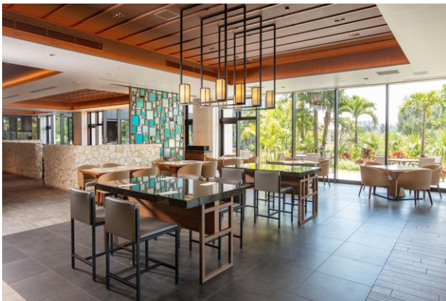
ソーシャルディスタンスを保ったテーブル配置

ハイアット リージェンシー 瀬良垣アイランド 沖縄 感染防止ガイドライン： hyattregencyseragaki.jp