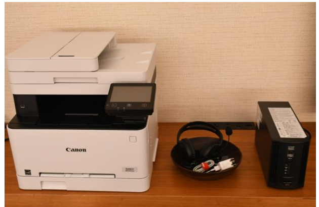
客室のリモートワーク応援機材