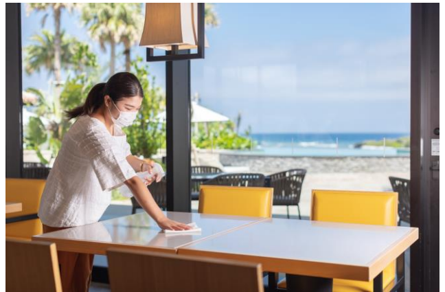
館内のアルコール消毒の強化