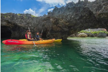
シーカヤックツアー

※ホテル館内の屋外プール、ビーチは冬季期間中（2021年11月8日～2022年3月19日）はクローズしております。