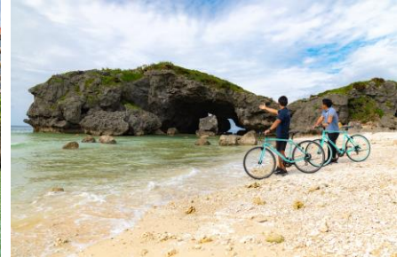
58号線うみかぜ自転車旅