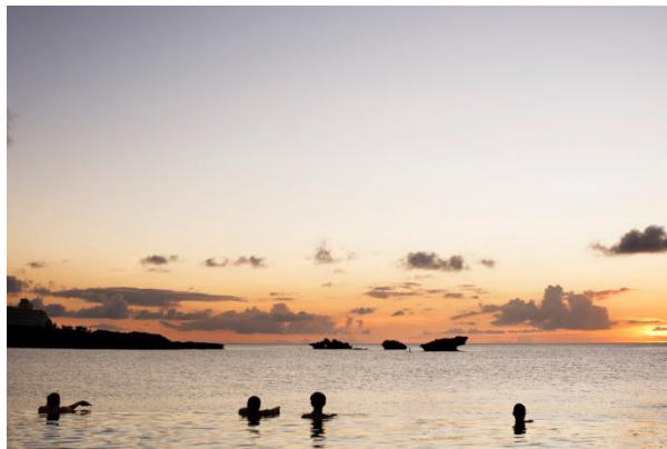
ラグーンで味わう、まさに海と一体になる時間