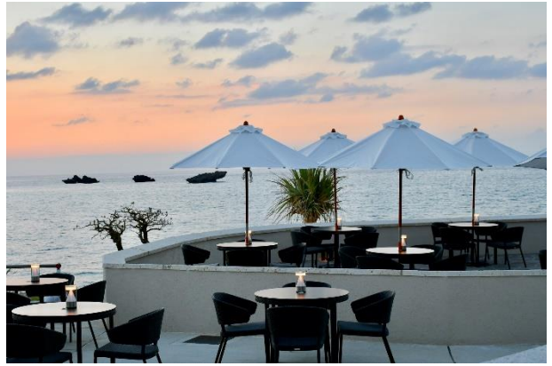
※テーブル配置は変更可能性がございます、ご了承ください。