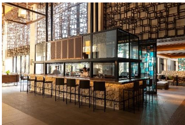
開放的なロビーエリアに位置する「ロビーラウンジ&バー」

ナイトプール実施期間中、「プールサイドバー」と「ロビーラウンジ&バー」を行き来いただけるビバレッジパス付きの宿泊プランを開業以来初の試みとして販売開始いたします。