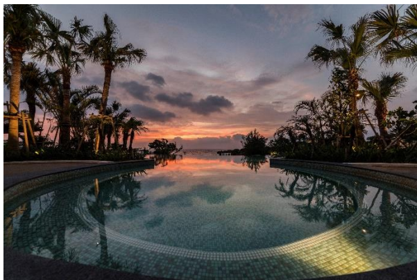
グスクプールから望むサンセット

360度海に囲まれたプライベートアイランドである瀬良垣島で、日中は、青空に包まれた開放的なプールを、夜にはカラーライトアップされたプールと、このゴールデンウィークと夏は、昼夜を通してリゾート感たっぷりの空間でお過ごしてください。