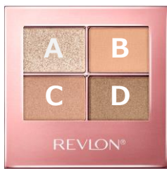
003 ミルキー サンド