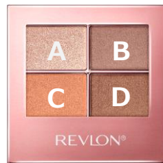
004 ハニー テラコッタ