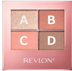
002 ピー チ ヌード