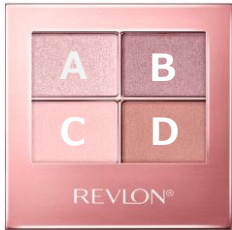
001 ペビ ーロゼ