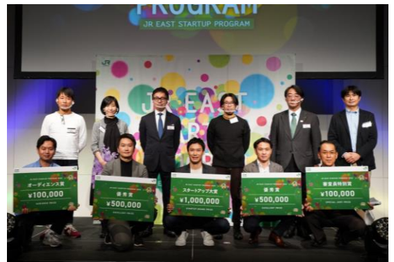
写真 DEMO DAY表彰式