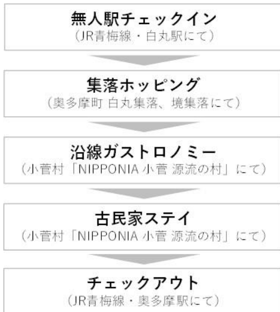
図 沿線まるごとホテル 体験・宿泊プランの流れ

また、参加者に対してアンケート調査を行ったところ、参加者満足度、価格に対する評価、事業化の際の利用意向、いずれも高い評価を得ることができたため、事業化に向けた検討を進めています。