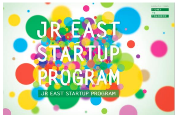
JR東日本スタートアッププログラム