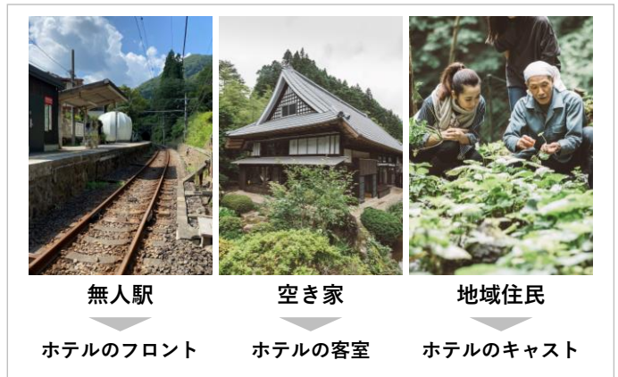
図 沿線まるごとホテルの事業イメージ