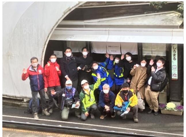
写真 沿線まるごとホテルの実証実験風景（活用した無人駅「白丸駅」でのプロジェクトメンバーの記念写真）