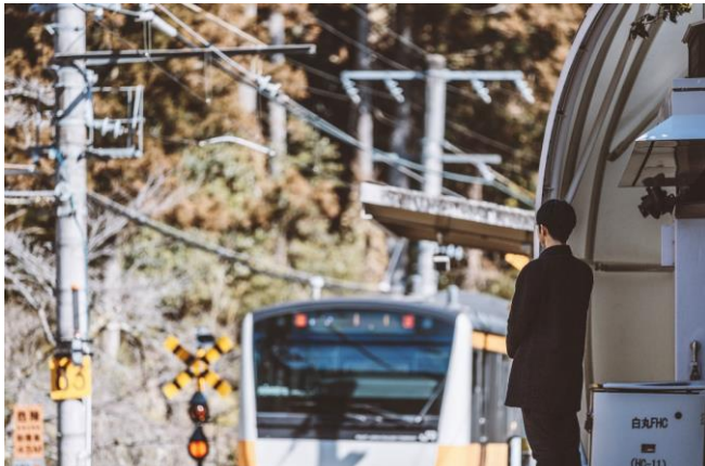
写真 青梅線の無人駅「白丸駅」でお客さまを待つホテルコンシェルジュ