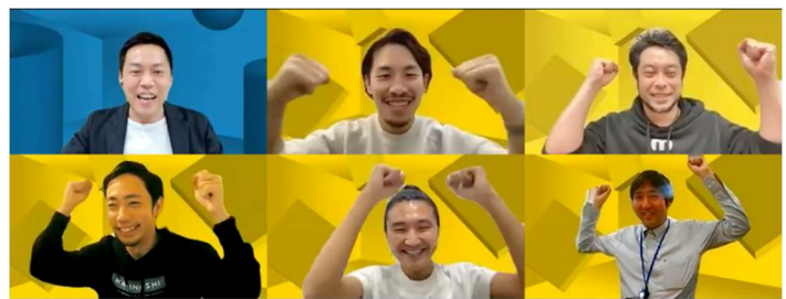
▲各賞を受賞した事業者と司会者

「スタートアップ大賞」を受賞したメトロウェザーの東取締役は「将来は、この技術をさらに発展させ、車両の自動運転や線区全域の風況観測、ホーム転落検知システムなどへの応用も見据えている。鉄道の安心・安全に貢献したい」と喜びの声を語りました。