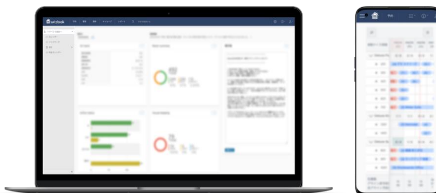
<suitebook オペレーション画面イメージ>