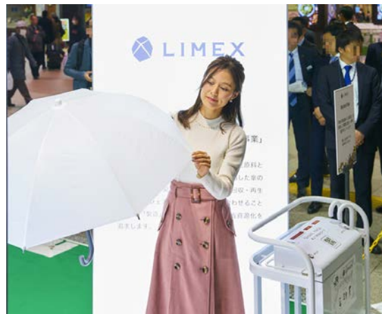
駅ナカ傘シェアリング事業での再生可能素材の製品化 (株式会社 TBM との取り組み)