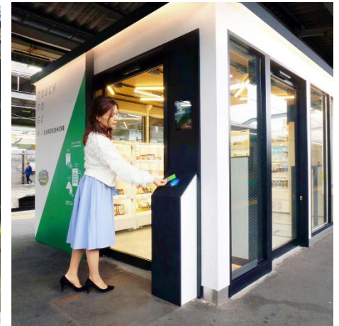
AI 無人決済店舗によるサービスの効率化 (サインポスト株式会社との取り組み)