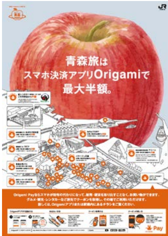
青森におけるインバウンド旅行客への QR 決済利用の促進 (株式会社 Origami との取り組み)

これにより、スタートアップ企業のバリューアップに貢献したほか、JR 東日本の鉄道事業だけではなく、グループ全体を実証実験の場とした活動を展開し、多様な新規サービスの提供を実現しています。