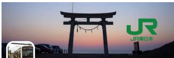
房総エリア支援コミュニティ