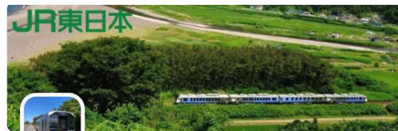
つがるエリア支援コミュニティ