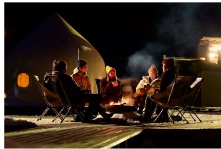
DOAI VILLAGE 滞在イメージ