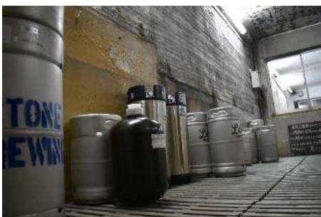
熟成させている様子