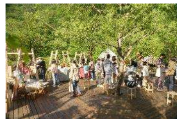
イベントのイメージ