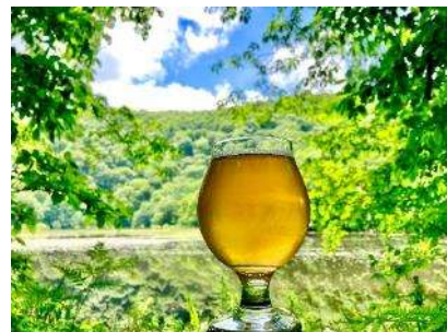
モグラ熟成ビールのイメージ