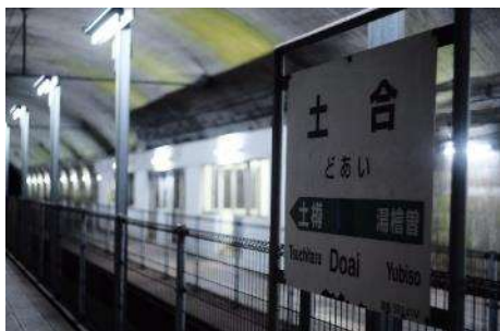
土合駅地下ホーム

株式会社 VILLAGE INC (以下、VILLAGE INC.) は、ビール醸造を通じて自然への取り組みを行うブルワリーの集まりである Brewing for Nature と東日本旅客鉄道株式会社 高崎支社(以下、JR 東日本高崎支社)、JR 東日本スタートアップ株式会社 (以下、JR 東日本スタートアップ)、地域の皆さまと協力し、群馬県の上越線土合駅にある「DOAI VILLAGE」において、地下ホームで熟成させたクラフトビールを楽しめるイベント『もぐらビアキャンプ』を開催します。このイベントを通じて、みなかみの魅力を発信すると共に、イベント収益の一部を森林保全活動に寄付することで、地域の活性化や自然環境の保護への取り組みを推進していきます。