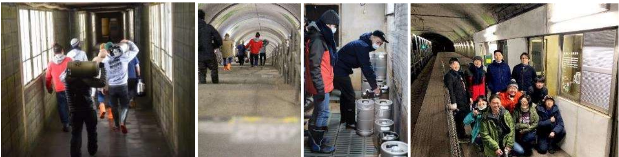
クラフトビールを運ぶ様子

土合駅の下りホームは上越線のトンネル内にあり、駅舎から標高差が70mあり、486段もの階段を下るため「日本一のモグラ駅」と呼ばれています。そんな地下ホームの小屋を活用して、一昨年から、地元みなかみ町のオクトワンプルーイングを始め、様々なブルワリーが参画し、クラフトビールを貯蔵してきました。「モグラ熟成ビール」は土合駅の地下ホームで熟成させたビールの総称であり、既に250リットルを超えるクラフトビールが貯蔵されています。発酵の終了したビールを地下ホームの低温の環境のもと、穏やかに熟成させることで、味や香りを調和させることができ、よりおいしいクラフトビールとなります。今回のイベントではこの「モグラ熟成ビール」を解禁し、お客さまに提供いたします。