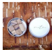
澄み香 森を持ち運ぶ アロマブロック「Matou」