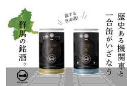
純米吟醸 JR 東日本 SL(D51)・SL(C61) 一合缶®