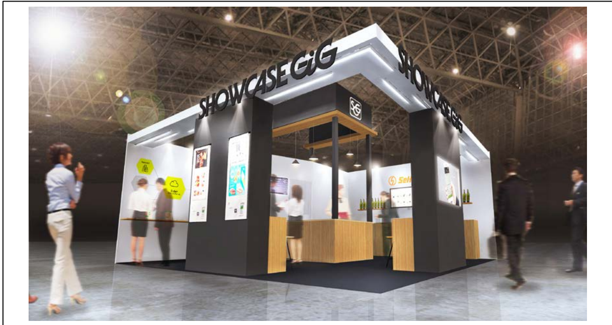
【出展ブースイメージ】

昨今の日本では、少子高齢化による労働人口減少が社会的な問題となり、店舗の生産性向上やキャッシュレス化は急務の課題となっています。そんな中、ショーケース・ギグが目指すリアル店舗は店舗運営の現場における業務効率化や省人化による人件費の軽減に加え、利用者であるお客様の利便性と満足度を最大限に叶える店舗です。IoTを中心としたデジタル技術の革新で様々な新サービスを実現し、店舗とお客様双方の利便性を実現するサービスを身近な現場に浸透させたいと考えています。ご来場の皆さまに、ショーケース・ギグが展開するサービスを実際に見て、体験して頂ければと考えております。