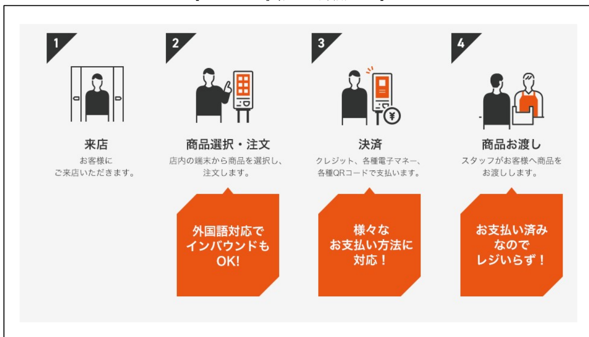
【「O:der Kiosk」導入による利用フロー】

尚、従来モバイルオーダーと同様、店内の各種端末や外部インターネットサービスとの接続先も随時増やしていく予定です。