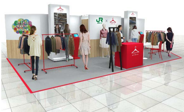
品川駅 会場イメージ