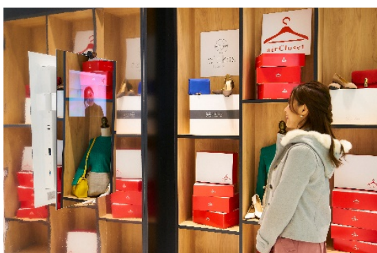
遠隔ファッション診断 体験イメージ

これは、駅における「時間価値の創造」と忙しい女性へ「より豊かなライフスタイルの提供」を目的に実施する施策で、お客様がスタイリストと遠隔にいる状態において、リアルタイムにパーソナルスタイリングを受けられる体験型コンテンツです。