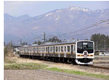
▲「いろは」編成のイメージ

2019年11月2日（土）～4日（月・祝）の間に運行する全車指定席の臨時列車です。運転区間は、川越（10:00 発）～日光（12:39 着）、日光（19:11 発）～大宮（21:33 着）。205系4両「いろは」編成で運転します。「いろは」編成は、2018年4月1日（日）から運行している観光仕様の列車です。