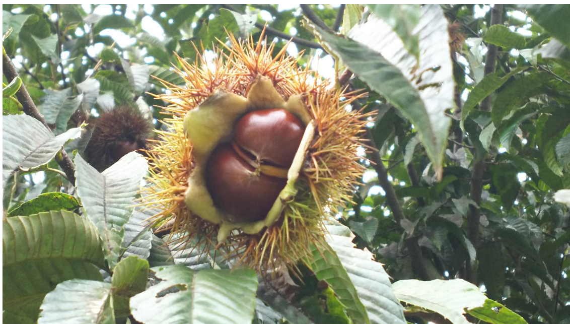
水と緑豊かな美しい里山で育った市原市の栗を使用

今年2021年は、昨年の台風の影響も残る中、今年も厳しいと想定していましたが、計画通りの栗の収穫を行うことができました。8月25日より、石井食品公式 無添加調理専門店「イシイのオンラインストア」にて予約販売を開始。大変ご好評をいただき、9月末に予定販売数（746個）を達しました。