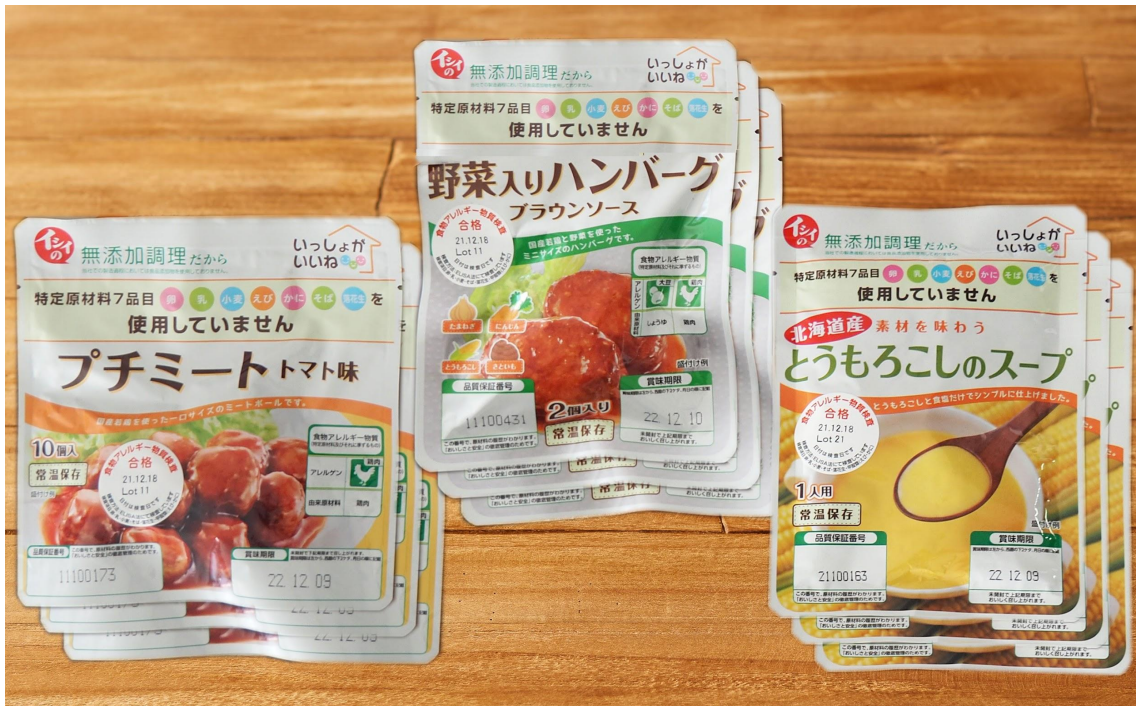
「食物アレルギー配慮 いっしょがいいね人気3種セット (3種×各3袋) (常温品)」