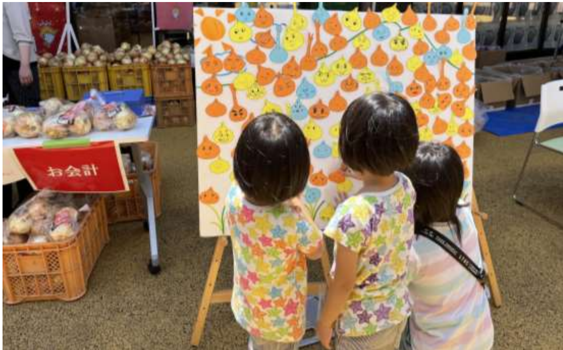
玉ねぎの形に切った色紙に顔を書いてもらい、ボードに張り付ける体験イベント