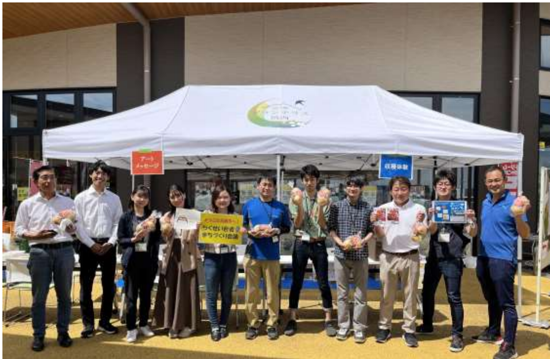
ちくせい若者まちづくり会議の学生と石井食品社員

が課題となっております。その解決の一助として、これからの社会を担っていく若い世代から、地元の野菜について興味を持ってもらい、認知を広めることで、地域を盛り上げ、農業の衰退を防ぎたい、という思いから、2020年10月に発足した大学生からなる団体「ちくせい若者まちづくり会議」のカフェ・アミコチームと共同で、収穫祭・販売会を企画いたしました。茨城県の方に向けたイベントを実施することにより、まずは地元の方に「館玉ねぎ」のファンになっていただき、若者の農業離れと農業就業人口の高齢化を防ぐ一助になればと考えています。