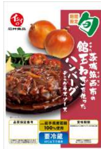
今年の新デザイン