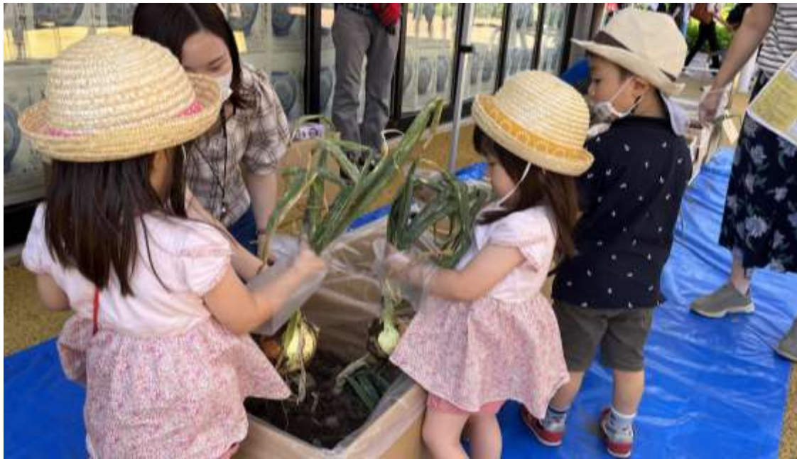
小石の多い館玉ねぎの農地環境を段ボールとビニール袋で再現