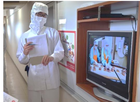
※過去に開催した八千代工場見学の様子

※4 パッケージにオリジナルの絵を書いたミートボールをご自宅に持ち帰りいただけます。（ミートボールはツアー当日中にお召し上がりください。）