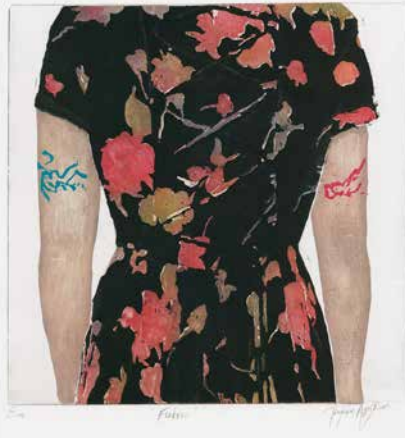
準大賞：Angelina TSOUMANI (ギリシャ) 「Fabric」 etching / aquatint / engraving / linocut 20×16.5cm