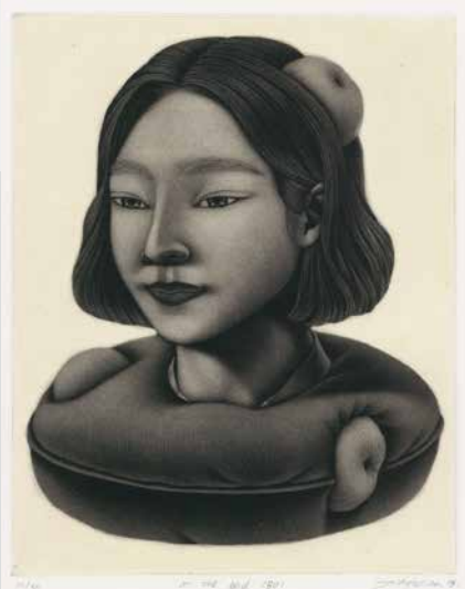
大賞：Jihye LIM (韓国) 「at the bed 1801」 mezzotint 21.5×17.3cm