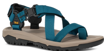
Blue Coral(ブルー コーラル)