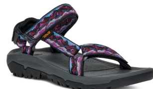
Mountain Mosaic Crown Blue (マウンテン モザイク クラウン ブルー) ※OSHMANN'S限定、23-29cm展開