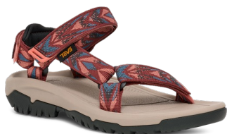
Archive Wings Blooming Dahlia (アーカイブ ウィングス ブルーミング ダリア)