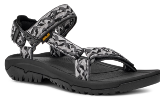
Mountain Mosaic Grey/Black (マウンテン モザイク グレー/ブラック) ※OSHMANN'S限定、23-29cm展開