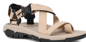
White Pepper(ホワイト ペッパー)