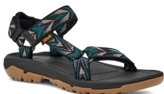
Archive Wings Black/Tan (アーカイブ ウィングス ブラック/タン)