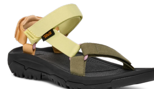
Pastel Multi(パステル マルチ)