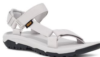
Vapor Blue(ベイパー ブルー)