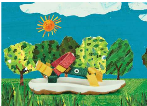
™ & © 2019 Eric Carle LLC.