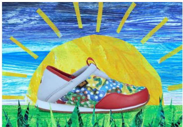
™ & © 2019 Eric Carle LLC.